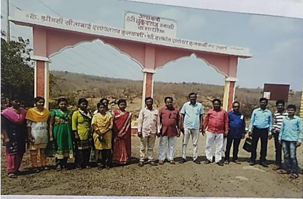
In front of Sant Mukundaraj Entry gate Ambagogai