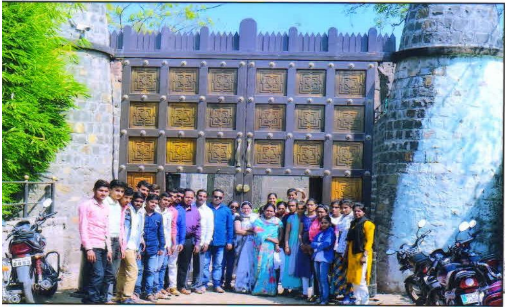
Infront Of Naldurga Fort