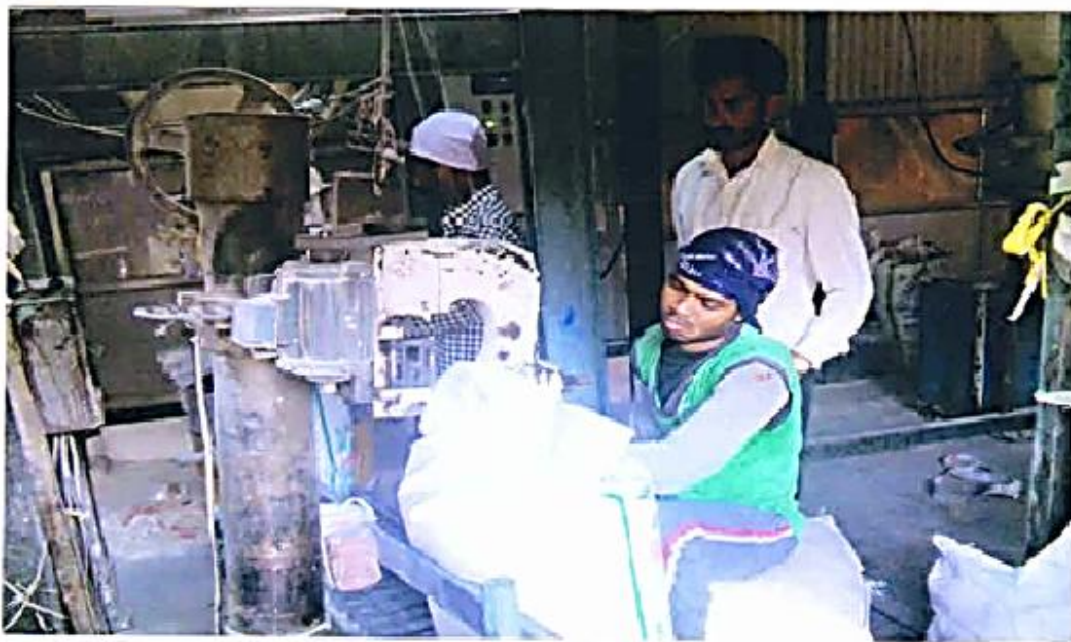
Sugar Packaging process