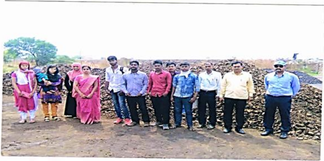
In Front front of steal Factory Raw materil