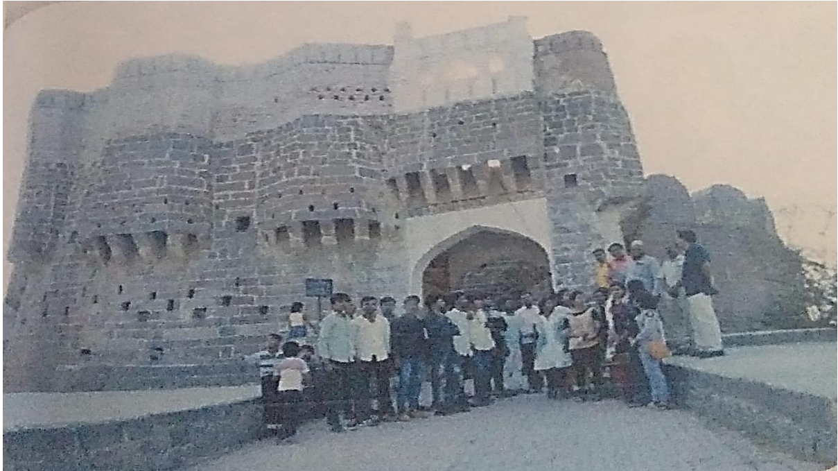
Fort of Ausa

Photograph of history department study tour in the year 2019