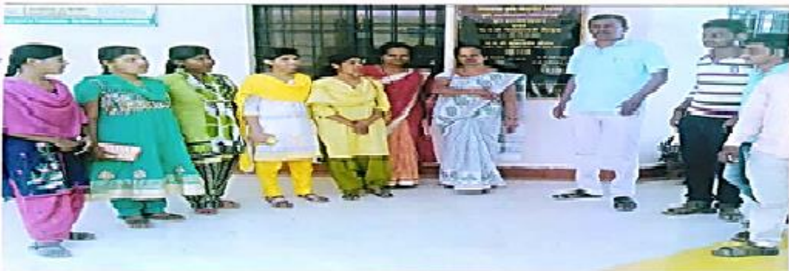
Tour visit of Economics department to Ambajogai Library in 2018-19