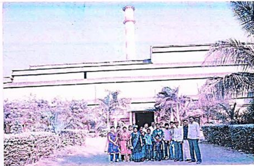
In front of Pangeshwar sugar factory with college staff and student