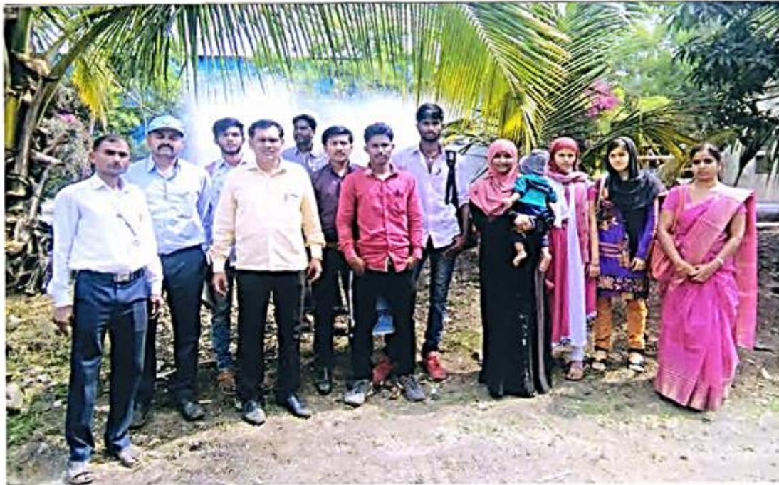
In Front of Sai Sugar Mill