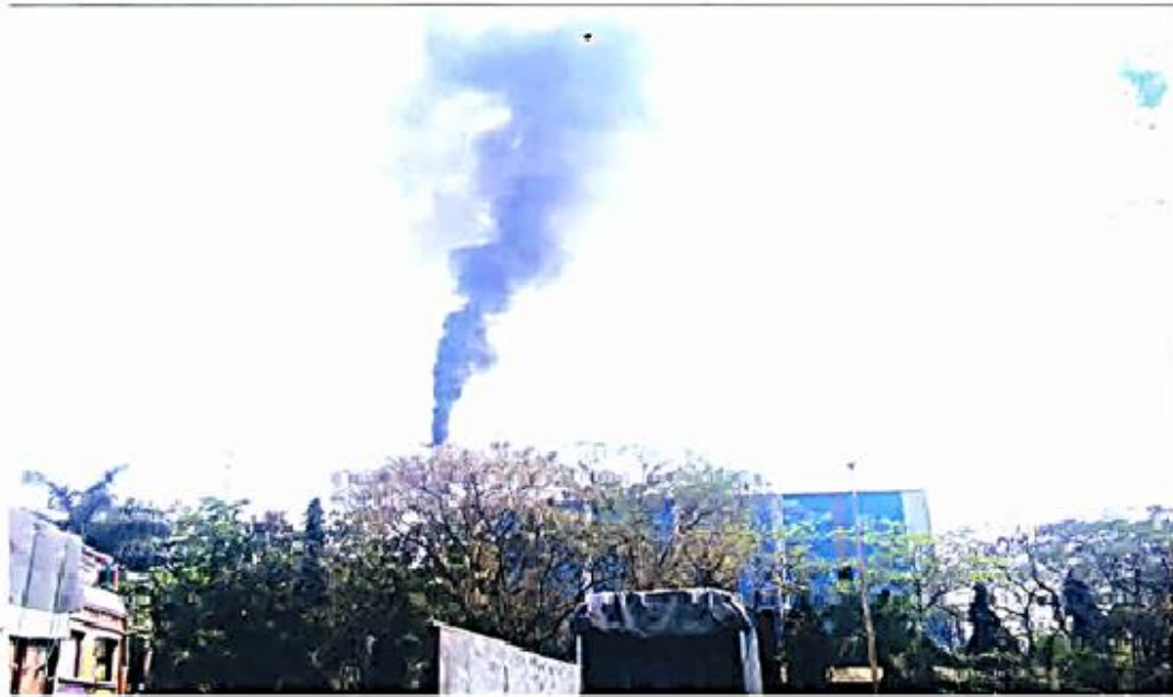
Sai Sugar Mill