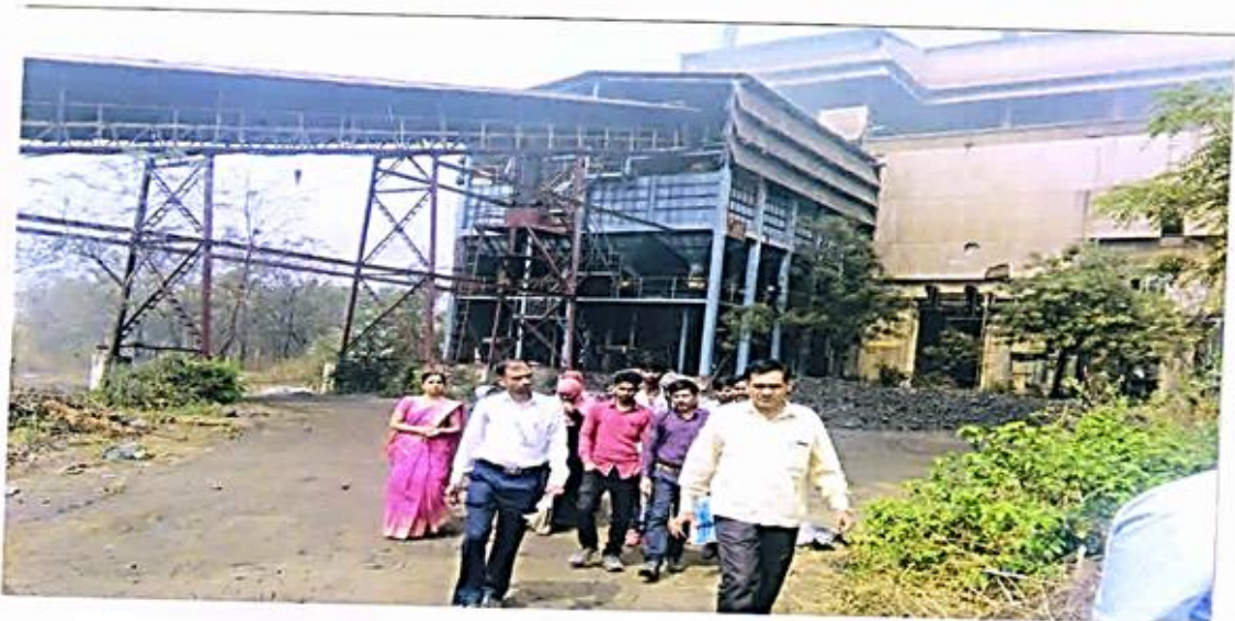
watching steal plant