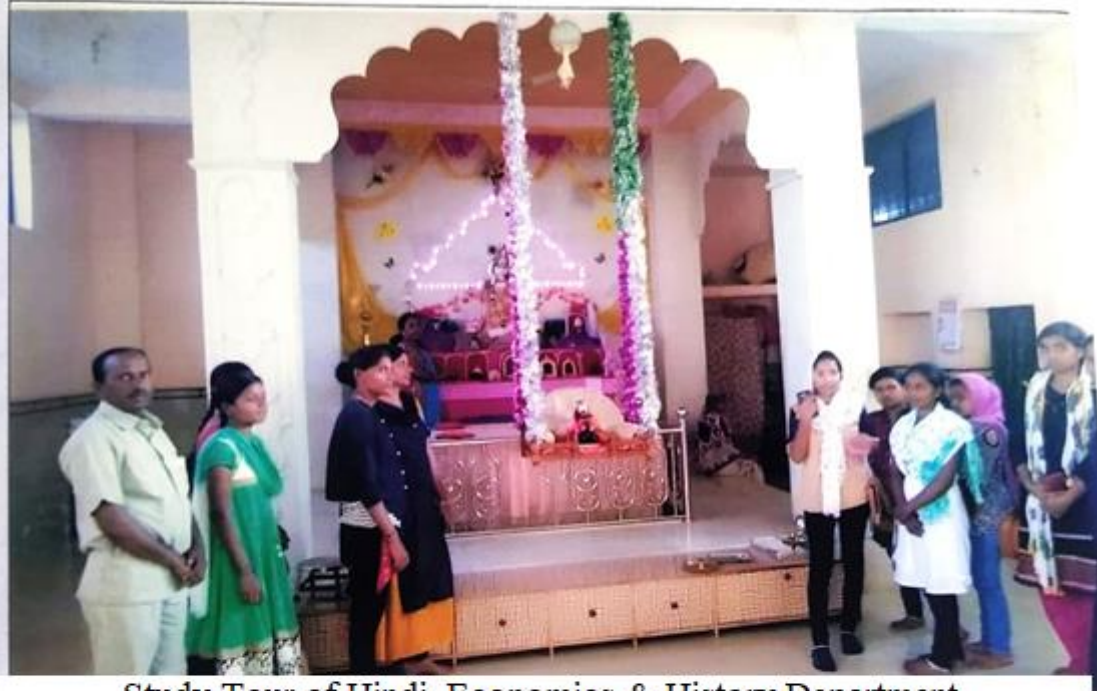
Study Tour of Hindi, Economics & History Department for academic year 2018-19 to watching Govind prabhu mandir belongs to mahanubhav pantas