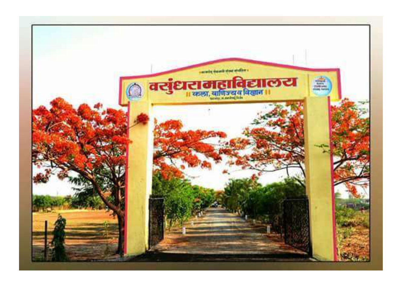
7.1.8 - Describe the Institutional efforts/initiatives in providing an inclusive environment i.e., tolerance and harmony towards cultural, regional, linguistic, communal socioeconomic and other diversities (within 200 words)