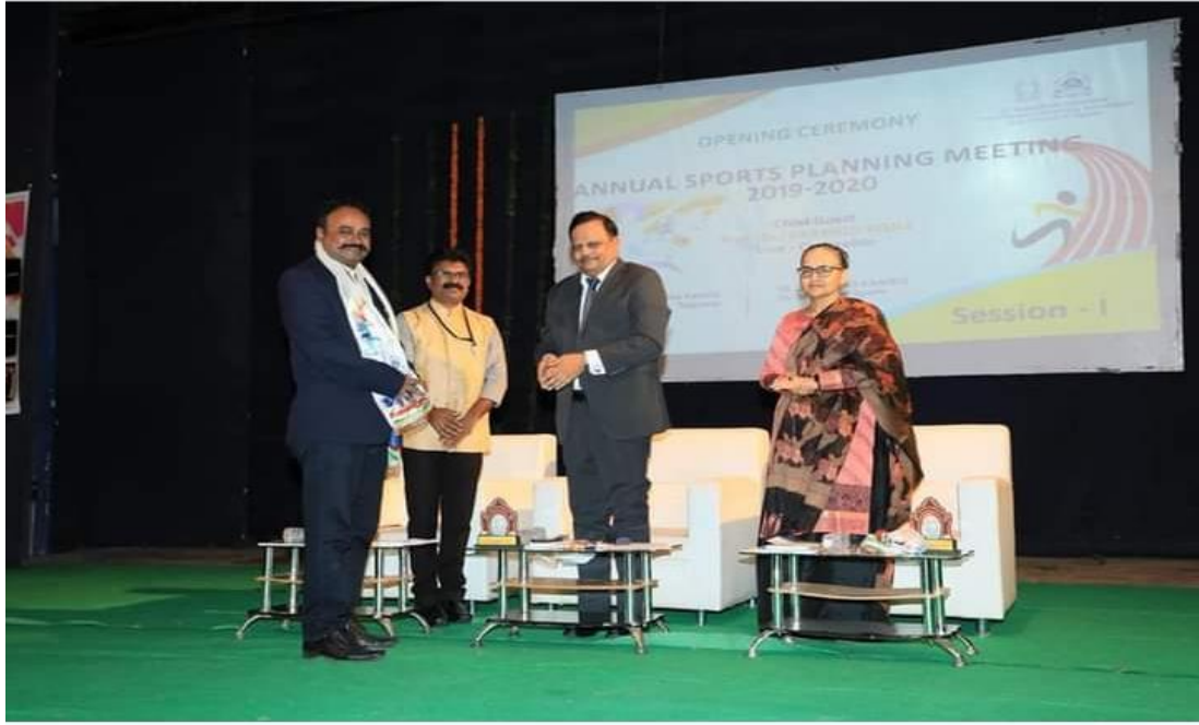
Mahatma Jotirao Phule Model Teacher 2021